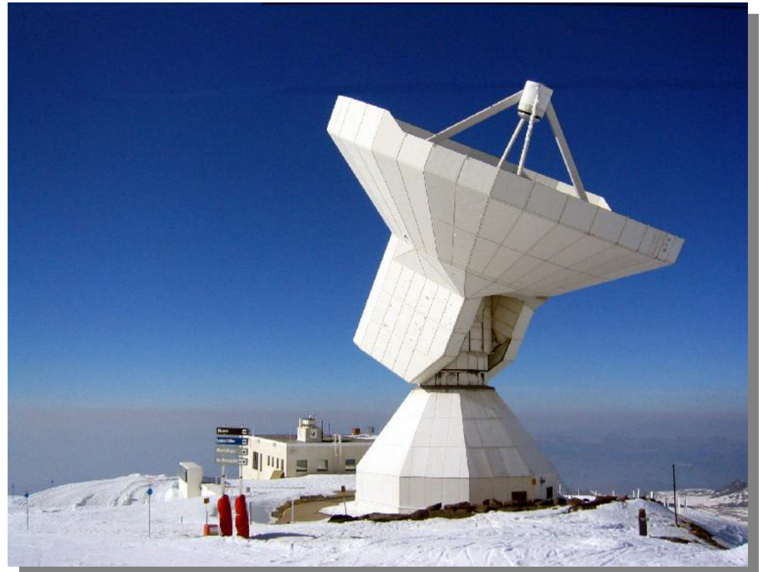
Fig. 1 Radiotelescopio IRAM-30m en la Sierra Nevada (Granada).

El radiotelescopio de 30 metros (vease Fig. 1) del Instituto de RadioAstronomía Milimétrica (IRAM) está ubicado en Sierra Nevada (Granada) a 2.920 metros de altura. Se encuentra operacional desde 1981 bajo la colaboración del IGN (España), CNRS (Francia) y del Max Planck Institut (Alemania). El telescopio opera en la banda milimétrica del espectro electromagnético y debido a la absorción atmosférica, sólo son observables tres franjas del mismo: 80-115 GHz, 130-183 GHz y 200-280 GHz. Los receptores heterodinos permiten observar 4 frecuencias a la vez y los bolómetros en banda ancha (100 GHz) a 1.2 milímetros. A estas frecuencias se detectan principalmente las transiciones rotacionales de moléculas en el medio interestelar y la emisión térmica del polvo.